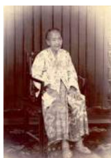
10 1895Jo Heng Nio.-2