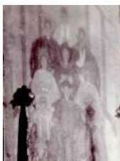
3 1860gezin Kan Keng Tjong