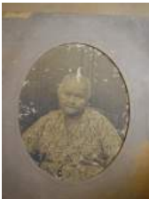
14 1900 Ma De-Kan Eng Nio

tot 1868 Tongkangan, Batavia