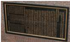
34 1893 Paneel Majoor der Chinezen LTH