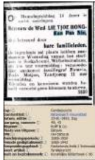
30 1933 0123 Overl. Kan Pan Nio Bat. Nieuwsbl.0116