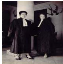
118 1931 De Tan graduation