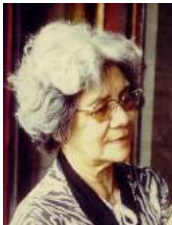
116 1985 De Kan-Tan

Kinderen van Tjiang Nio en Hay Gwan: zie 1.5.2.2.