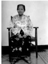
29 1910 Kan Pan Nio