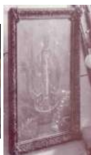
2 1860 Kan Keng Tjong