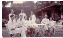
49 1925 fam. Kan