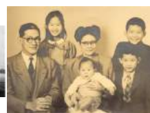
106 1948Familie Kan