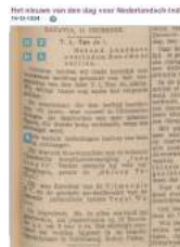
68 1934 1214 Overlijden TLT