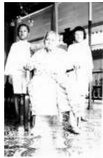
15 1916 Kan Eng Nio Twa Ipoh