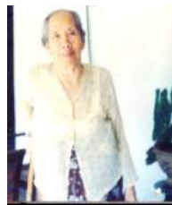
62 1965 Soma Gambir