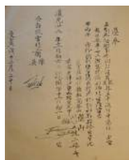
11 1848 Huw. Kan Keng Tjong-Jo Heng Nio-corr