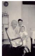
50 1948 Kan H.H., H.L., S.Y