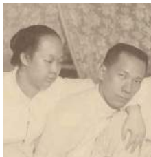
48 1910 Kan Hok Hoei Lie Tien Nio