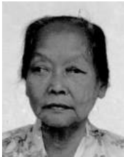
28 1910 Kan Pan Nio (2)