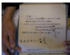
1 1832 Huw. Kan Keng Tjong