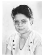
117 1930 De Tan