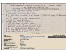
7 1861 0724 Javabode uitvoer silv. munt f.15450 KKT per ss Padang naar Singapore