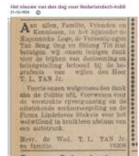
69 1934 1221 Bedank na begraven TLT