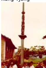
9 1983 Lanting KKT herdenkingszuil