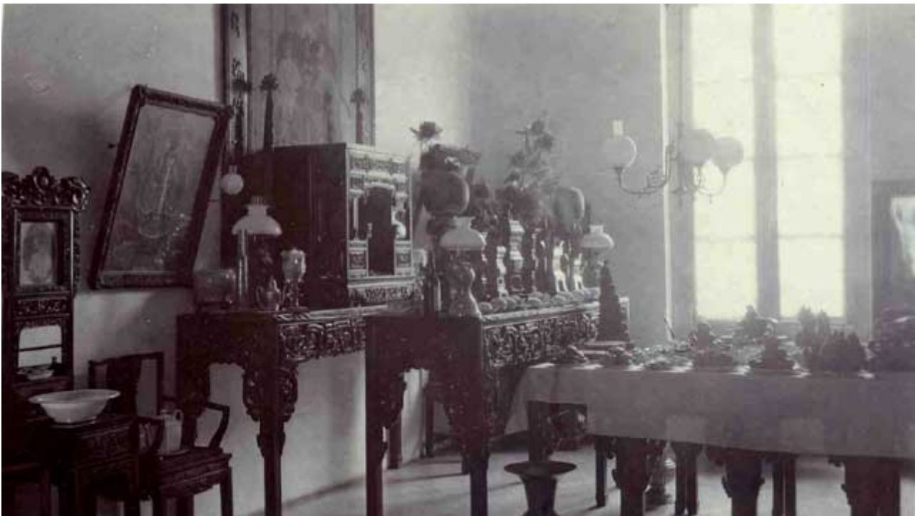
Het voorouderhuis en voorouderaltaar van de familie Tan