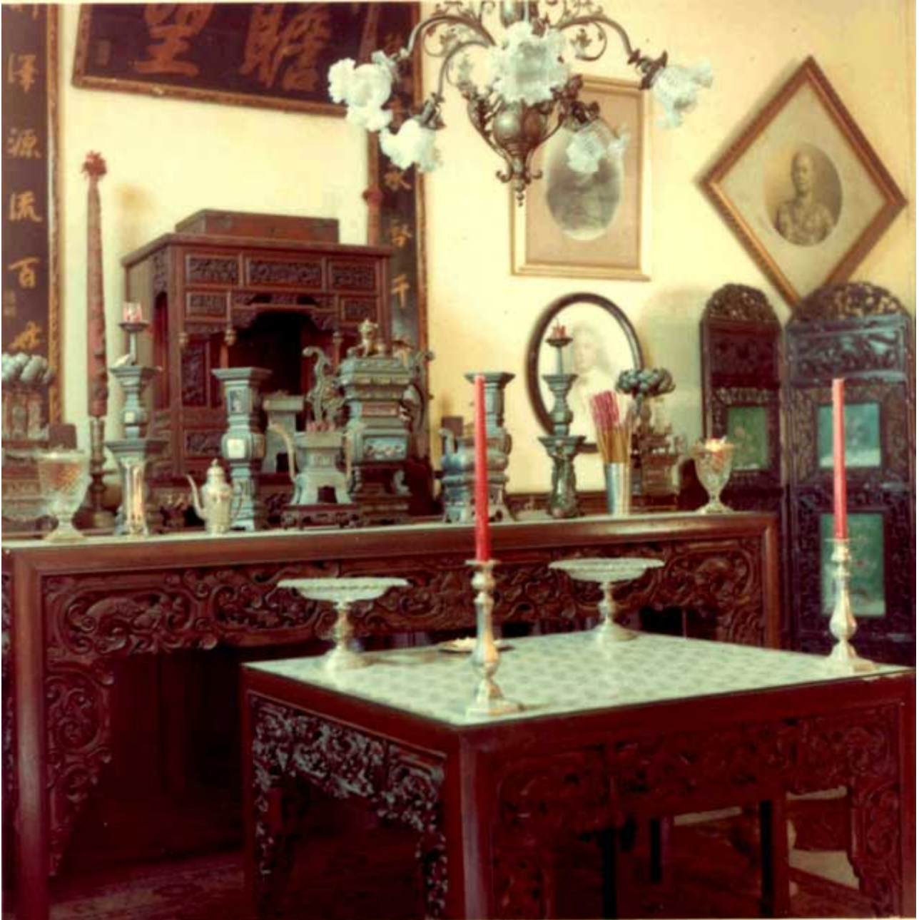
Het gecombineerde voorouderaltaar van de Kan, Han en Tan clan