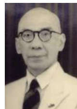
26 1948 Kan Hok Hoei