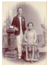
17 1901 Han Khing Bie