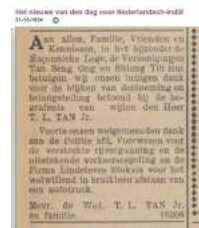
48 1934 1221 Bedank na begraven TLT