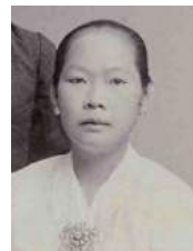
13 1894 Kan Oe Nio