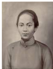
11 1885 Kan Oe Nio