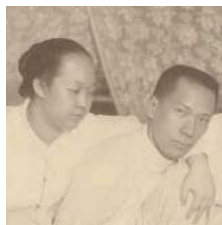
23 1910Kan Hok Hoei Lie Tien Nio