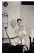
25 1948Kan H.H., H.L.,S.Y