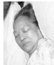
14 1910 Kan Oe Nio sterfbed