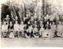
3 1885 Han familie