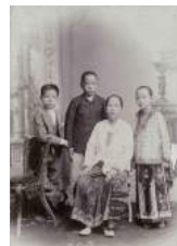
12 1894 Han gezin