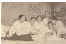
15 1910 Sterfbed Kan Oe Nio

1.7.4.1.3.1.9 Oen-Lee Han (afb. 9, 3 en 10) is geboren in 1856 in Soerabaja, zoon van Tjoei-Hing (Tjwie-Hing) Han (zie 1.7.4.1.3.1) en Emah Potjoh N.N.. Oen-Lee is overleden op 12-04-1893 in Batavia, 36 of 37 jaar oud [bron: Kong Koan 61401-p.082-3].