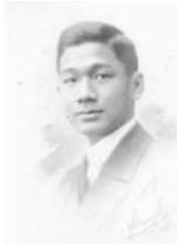
34 1928 Dary Kan