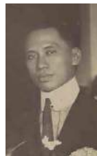
19 1920 Han Khing Bie