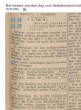
47 1934 1214 Overlijden TLT