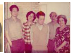
80 1980 gezin Kan