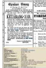
6 1882 Vendutie Han Tjoei Hing