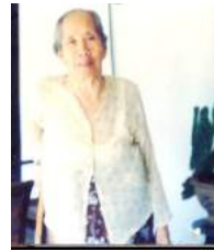
41 1965 Soma Gambir